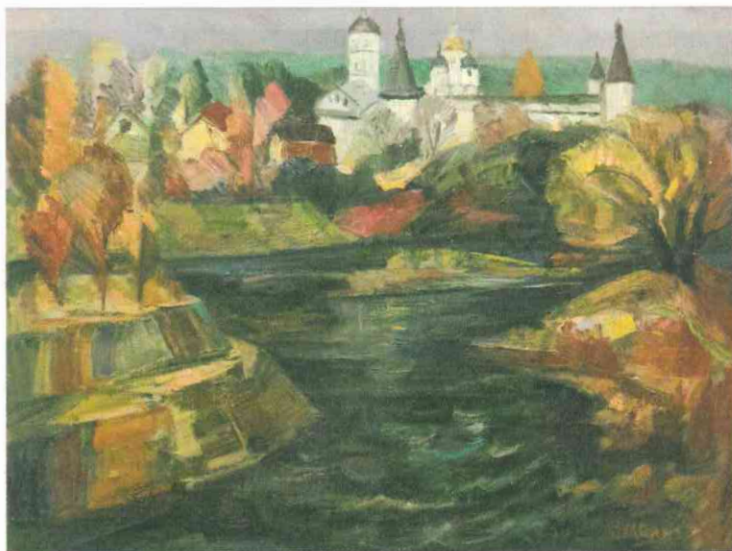
Ч. Цветкова. Река в Боровске. 2014

Многолетний опыт совместной пленэрной работы участников проекта «Русская провинция» - это не просто освоение средствами живописи уникального пространства старинных городов с их неповторимым «лицом» и бытовым укладом, но еще и новое понимание географии с точки зрения художника-путешественника. Принято считать, что расстояния между населенными пунктами исчисляются километрами пути. Это так. Тем не менее, для живописца, отправляющегося на пленэр, новые впечатления измеряются прежде всего этюдами, набросками, зарисовками.