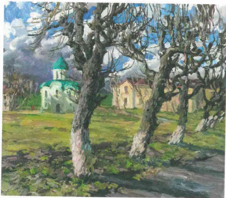
В. Лагутенкова. Первый снег в Переславле-Залеском. 2014

день вернисажа 29 мая 2015 года стал запоминающимся событием как для рязанцев, так и для гостей города. Выставочный зал на улице Есенина, 112 представил более сотни произведений живописи: пейзажей, натюрмортов и портретов. В экспозицию вошли живописные улочки Зарайска, домики Тарусы, холмы Серпухова, ландшафтное богатство Рязани, виды Пафнутьева монастыря в Боровске, колокольные перезвоны Коломны, оживленные площади в Переславле-Залесском, уникальный синтез архитектуры и природной красоты Суздаля, Владимира, Ростова Великого, Сергиева Посада и других городов России, в которых работали художники-пленэристы.