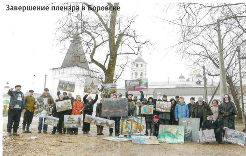
Завершение пленэра в Боровске